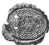
Pecetea lui Tudor Vladimirescu.